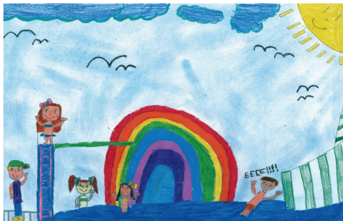
Disegno: Lina U

Dal 9 al 25 maggio 2019 il Festival Acqua e Luce vivrà la sua terza edizione. Artisti della luce locali e internazionali trasformeranno le fontane, le rive dei fiumi e le facciate della città di Bressanone in un mare di luci. Anche quest'anno ASM Bressanone SpA e la Bressanone turismo cooperativa invitano gli studenti delle scuole elementari e medie a diventare parte del progetto, partecipando ad una competizione di disegno e pittura. Tra tutti i disegni inviati, i migliori cinquanta verranno proiettati sulla facciata dell'Hotel Pupp per l'intera durata del Festival. Il tema del concorso è: "Il mio posto preferito all'acqua". Termine ultimo per consegnare le opere presso il Forum Bressanone in via Roma 9 è il 22 marzo. Ai vincitori spettano dei bei premi. Info: augchoell.petra@asm.it, tel. 0472 823 500